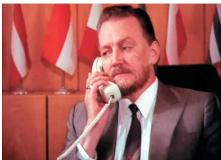
Кадр из фильма «Дорога в ад»

тый» ставит оригинальный хореографический номер, который сам называет «Икар на три минуты». Далее следует бесцветный фильм-балет «Имя твоё», сериал «В одном микрорайоне», несомненная удача – роль Хиггинса в фильме-балете «Галатее» по пьесе Б. Шоу «Пигмалион» и целый букет забавных образов в «Бенефисе Людмилы Гурченко». Своё 40-летие Лиэпа отмечает в Афинах, впервые исполняя партию Хозе в балете «Кармен-сюита» на сцене античного театра. Сыграл главные роли в фильмах «Детство Бемби» и «Дорога в ад».