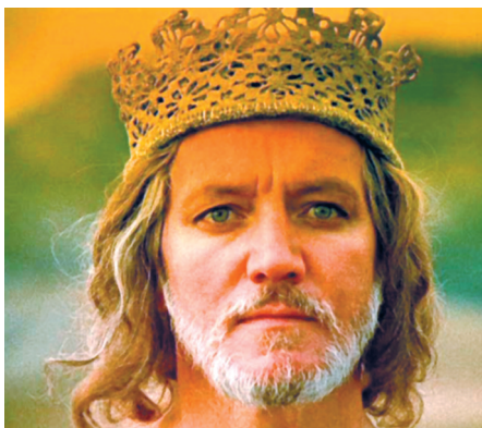
Кадр из фильма «Детство Бемби»

Сфера его деятельности не ограничивалась драматическим и танцевальным искусством – в конце 70-х годов он записал пластинку с песнями Давида Тухманова.