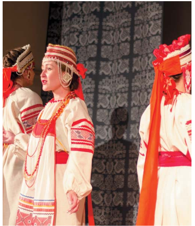
«Царская избранница, или ещё раз про любовь...»

Коллектив на всероссийском уровне представлял Рязанскую область с 20 по 23 ноября