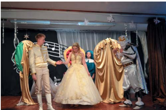
«Удивительная история о хрустальной туфельке» (2020 г.)

мотивам сказки Ш.Перро «Золушка» (2020 год). Зрители всегда с нетерпением ждут новогодних музыкальных постановок. Чтобы охватить всех желающих, спектакли показываются несколько раз для разных категорий населения.