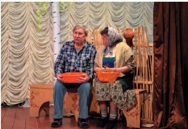
«Люби все возрасты...» (2019 г.)

мер, постановка «Царская избранница или еще раз про любовь...» по мотивам произведения В.Соловьева «Касимовская невеста» завоевала любовь и признание зрителей своей оригинальностью и изяществом. Также к достижениям народного коллектива «Истоки» можно отнести неоднократное участие в областных смотрах эстрадных любительских театров малых форм, где компетентным жюри отмечается хороший уровень исполнительского мастерства самодеятельных артистов.