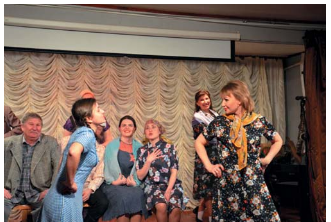
«Мир, война и Маруся» (2020 г.)

Репертуар коллектива многолик и разнообразен. Это не только спектакли, но и небольшие сценки, скетчи, монологи, миниатюры, литературно-музыкальные композиции. Так, напри-