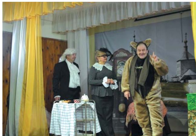
«Сон в Рождественскую ночь» (2018 г.)

В 2017 году театр малых форм «Истоки» показал рождественский спектакль «12 месяцев» по мотивам одноименной сказки С.Я.Маршака. Именно эта постановка стала настоящим театральным событием для коллектива – публика по достоинству оценила старания артистов и такие