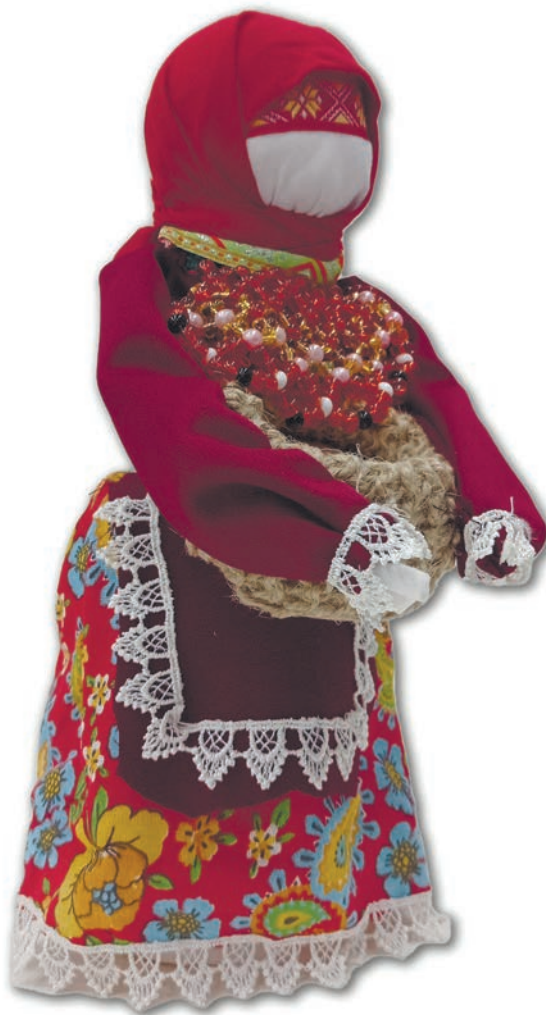
Кукла-столбушка «Пасхальная», 2022 г.