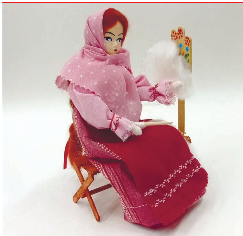
Кукла «Молодая пряжа», 2022 г., проволока, глина, ткань, h 25