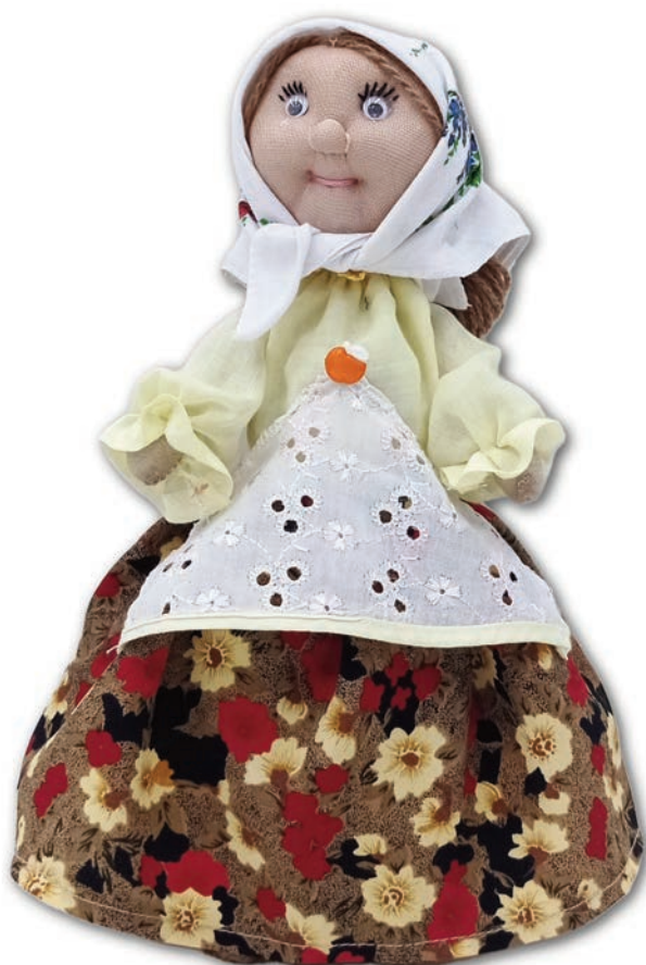
Кукла «Бабушка Шура», 2022 г., шитьё, ткань, пряжа

Вид художественного творчества: декоративно-прикладное искусство (вышивание крестом).