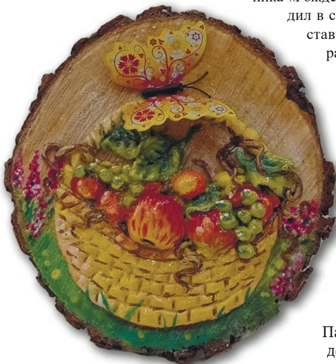
Панно «Вкусное лукошко», 2022 г., дерево, соленое тесто, лепка, Ø18