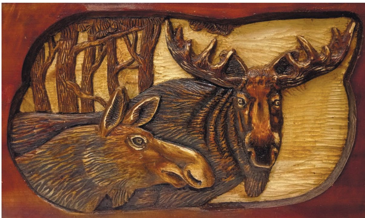
Панно «Лоси», 2017 г., резьба по дереву, берёза, 28x58