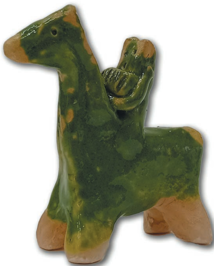
Игрушка «Всадник с гармошкой», 2022 г., глина, лепка, h 9