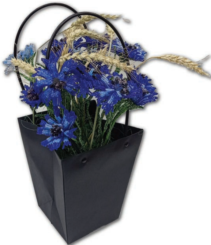
Композиция «Васильки», 2022 г., бисероплетение, бисер, h 40