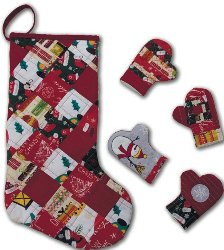
«Новогодний набор», 2021 г., лоскутное шитье, х/б ткань, 33x22, 11x8