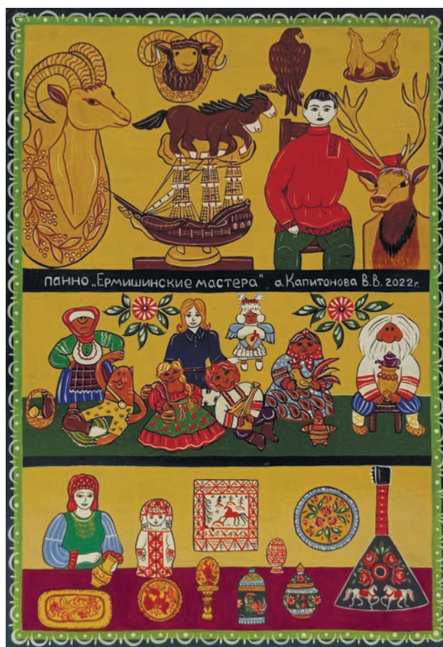
Панно «Ермишинские мастера», 2022 г., дерево, темпера, лак, городецкая роспись, 35x25