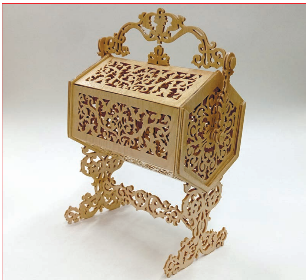
«Шкатулка», 2022 г., фанера, резьба, h 28