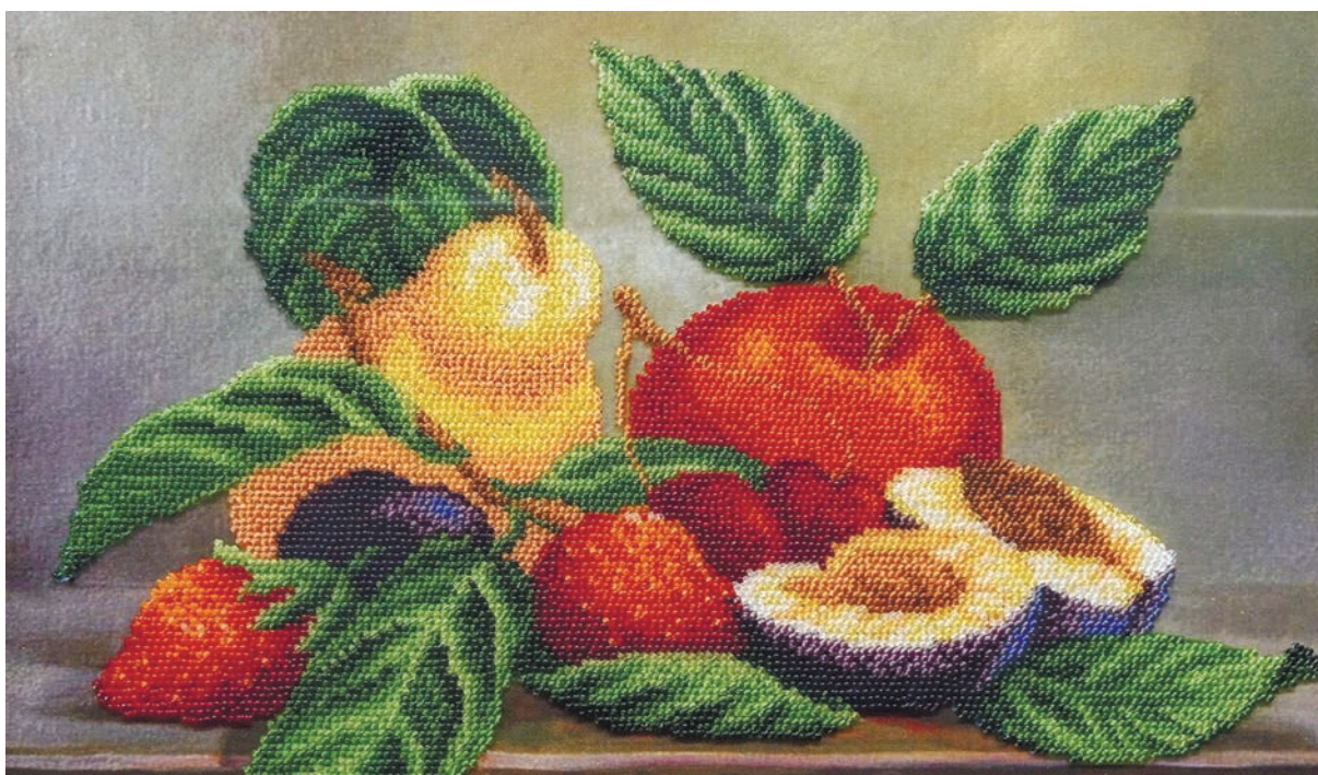
«Фрукты», 2021 г., бисер, 36x25

Вышивки животных, птиц, цветов, пейзажей сама мастерица считает несложными. А вот такие картины, как «Ласточкино гнездо» (замок на скале над морем в Крыму), «Клеопатра», «У фонтана», икона «Неопалимая купина» сложны по схеме и исполнению. И если простые картины можно вышить за две-три недели, то на сложные уходит до полугода.