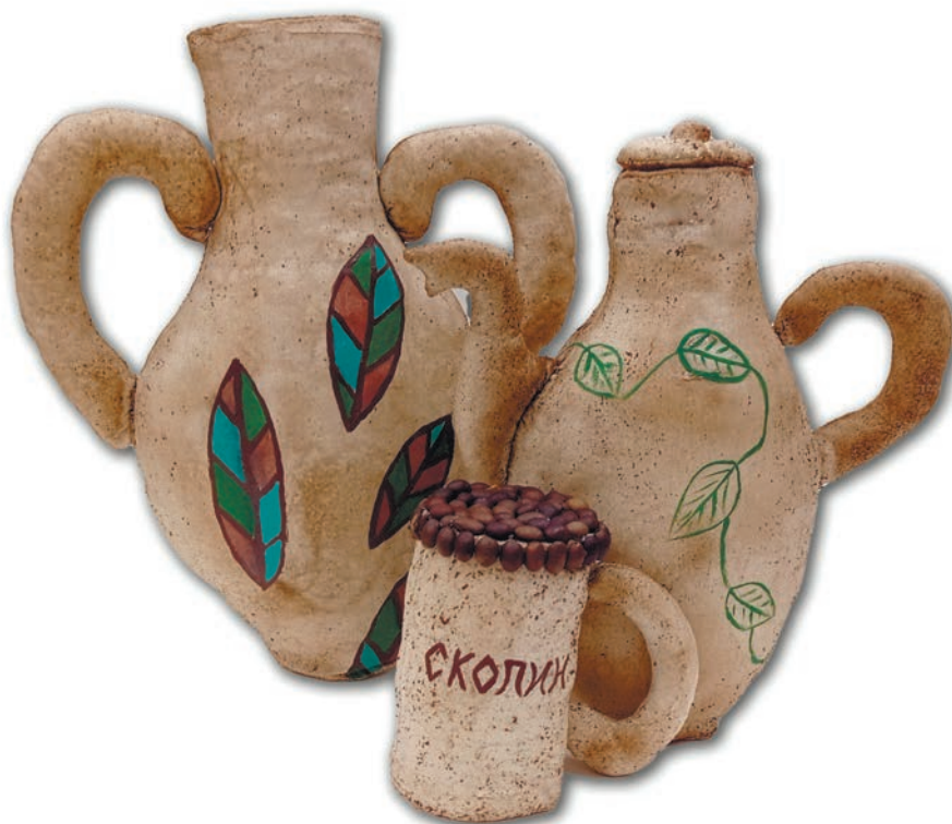
Композиция «Скопинский промысел», 2022 г., ткань, роспись

Юлия Юрьевна, совершенствуя свое мастерство, стала сочетать аромат кофе с эфирными маслами, создавая невероятные запахи, которые придают изделию особую душевность. Например, кофе отлично сочетается с запахом шоколада или апельсина, которые определенным образом влияют на настроение и состояние человека. Ведь хорошая атмосфера в доме – это залог счастья.