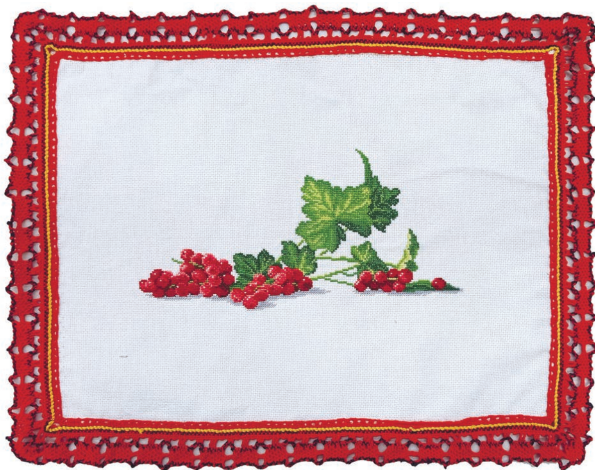
Салфетка «Красная смородина», 2022 г., лён, мулине, михайловское кружево, вышивка, 50х40

В выставках районного клуба художников-любителей «Гармония» принимает участие с 2019 г. К занятиям творчеством привлекла и свою семью – дочка тоже занимается кружевоплетением, а муж работает с деревом.