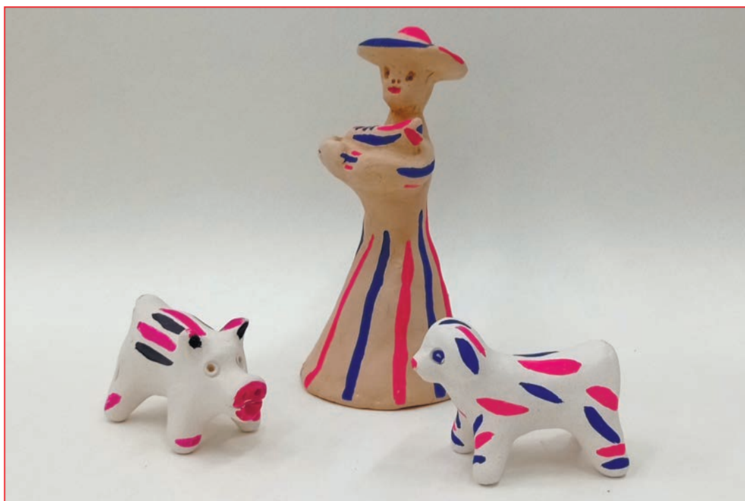
Композиция «Барышня с домашними животными» (7 шт.), 2020г., керамика, глина/акрил