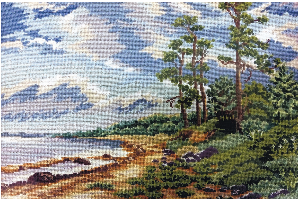
Панно «Рязанское раздолье», 2022 г., х/б ткань, мулине, вышивка крестом, 46x32