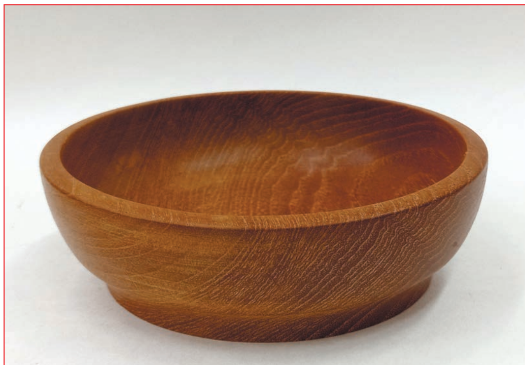
«Тарелка из палисандра», 2018 г., дерево, Ø 17,5;