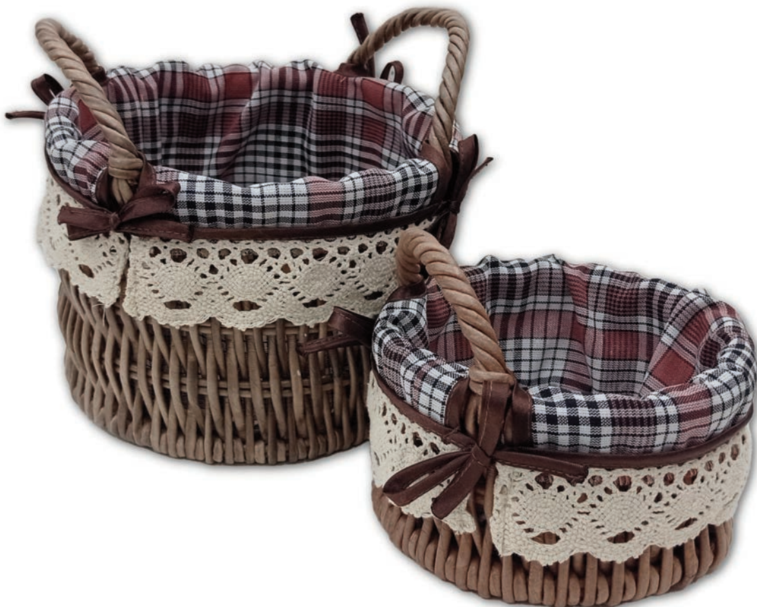
Набор корзинок в стиле Zara Home, 2022 г., бумажная лоза, морилка водная, акриловый лак, текстиль, кружево, 19x13,15x8