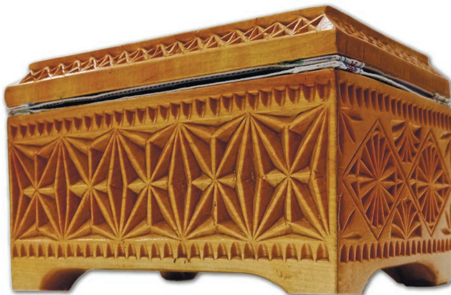
«Шкатулка», 2013 г., дерево, 15x18