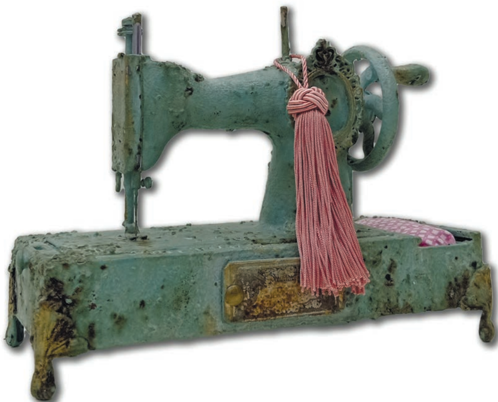
Игольница «Швейная машинка», 2019 г., состаривание, металл, h 20