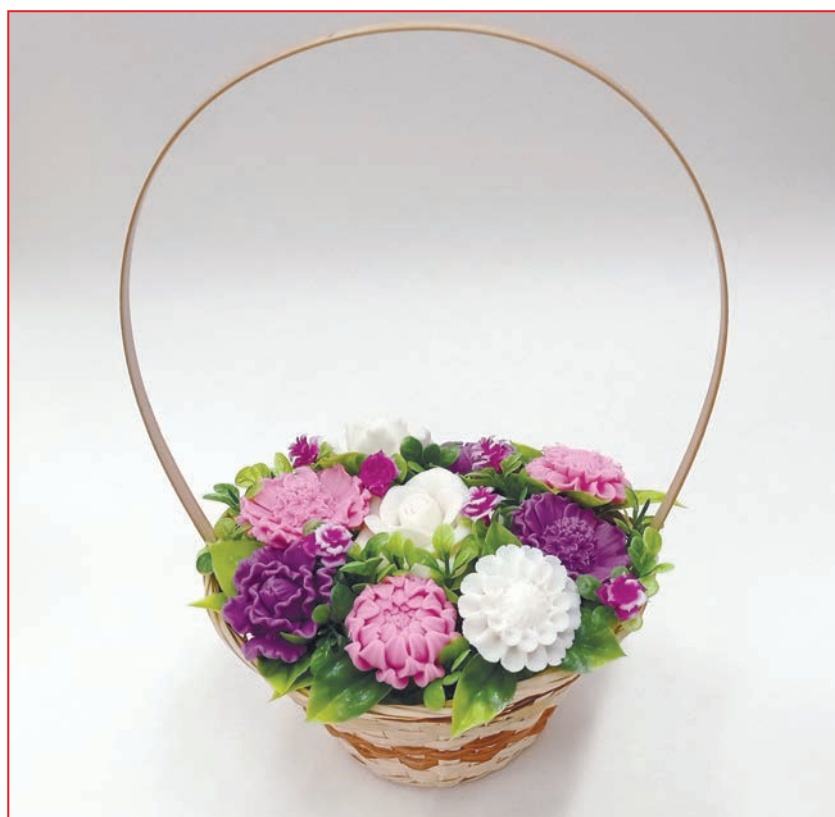
Мыло «Нежное послание», 2022 г., 25x25x25

С 2019 года является волонтером АНОЦПМС «Многомама». Оказывала помощь в организации благотворительного автопробега «Километры добрых дел», занимается благотворительной работой в центре «Многомама – Рязань – Милославское». Совместно с супругом принимала участие в благотворительной акции «Добрый новый год», где выступали в роли Деда мороза и Снегурочки для детей из нуждающихся многодетных семей. Награждена похвальным листом «Волонтер года – 2020».