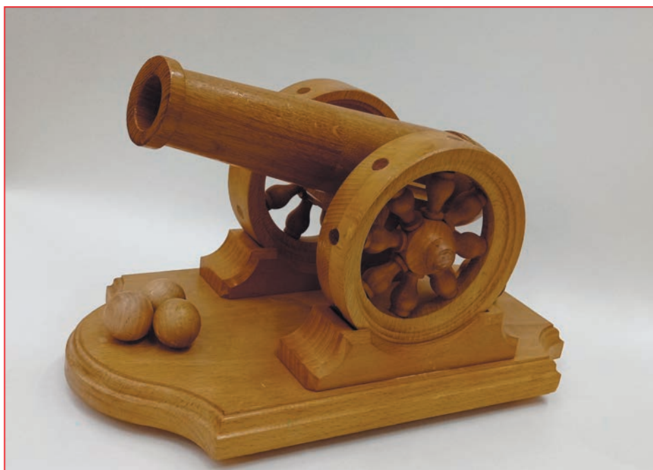
«Царь-пушка», дерево: бук, груша, h 18,5