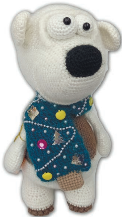
Игрушка «Медведь» , 2022 г., пряжа акрил, вязание крючком, h 28,5

Мастерица выставляется на городских и районных выставках, в библиотеке, РДК и музее.