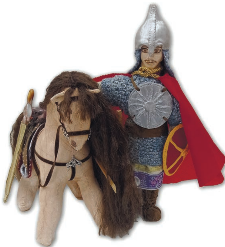
«Русский воин», 2021 г., h 35