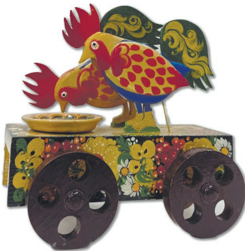
«Петушки», 2021 г., дерево, роспись, h 28

В настоящее время работает методистом в Касимовском техникуме водного транспорта. Продолжает свою творческую работу, активно участвует в фестивалях и выставках.