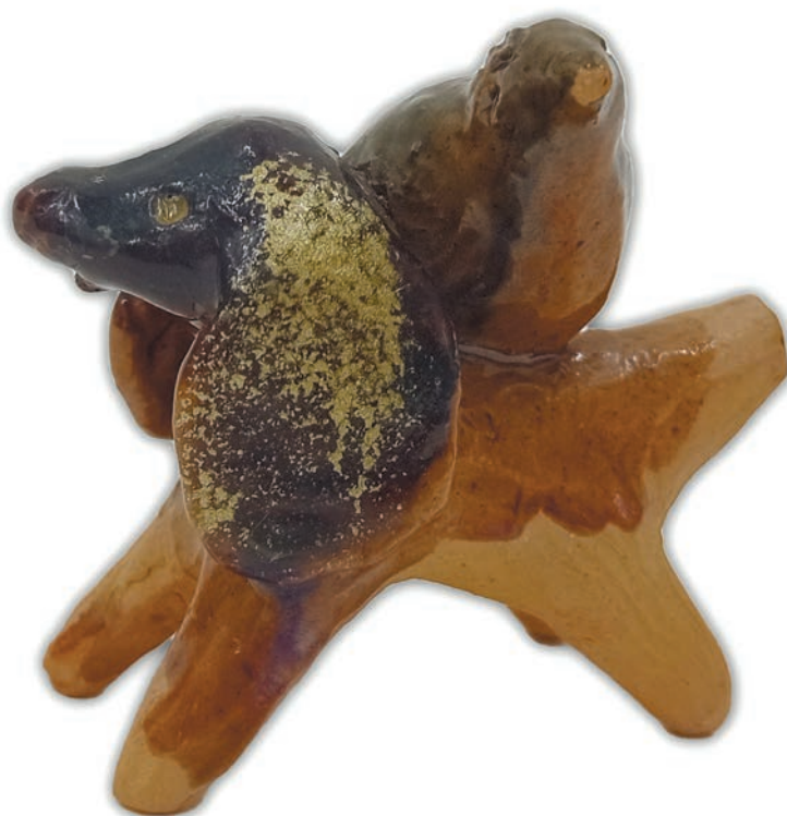
Свистулька «Птичка и собачка», 1997 г., лепка, глина, h 5,5