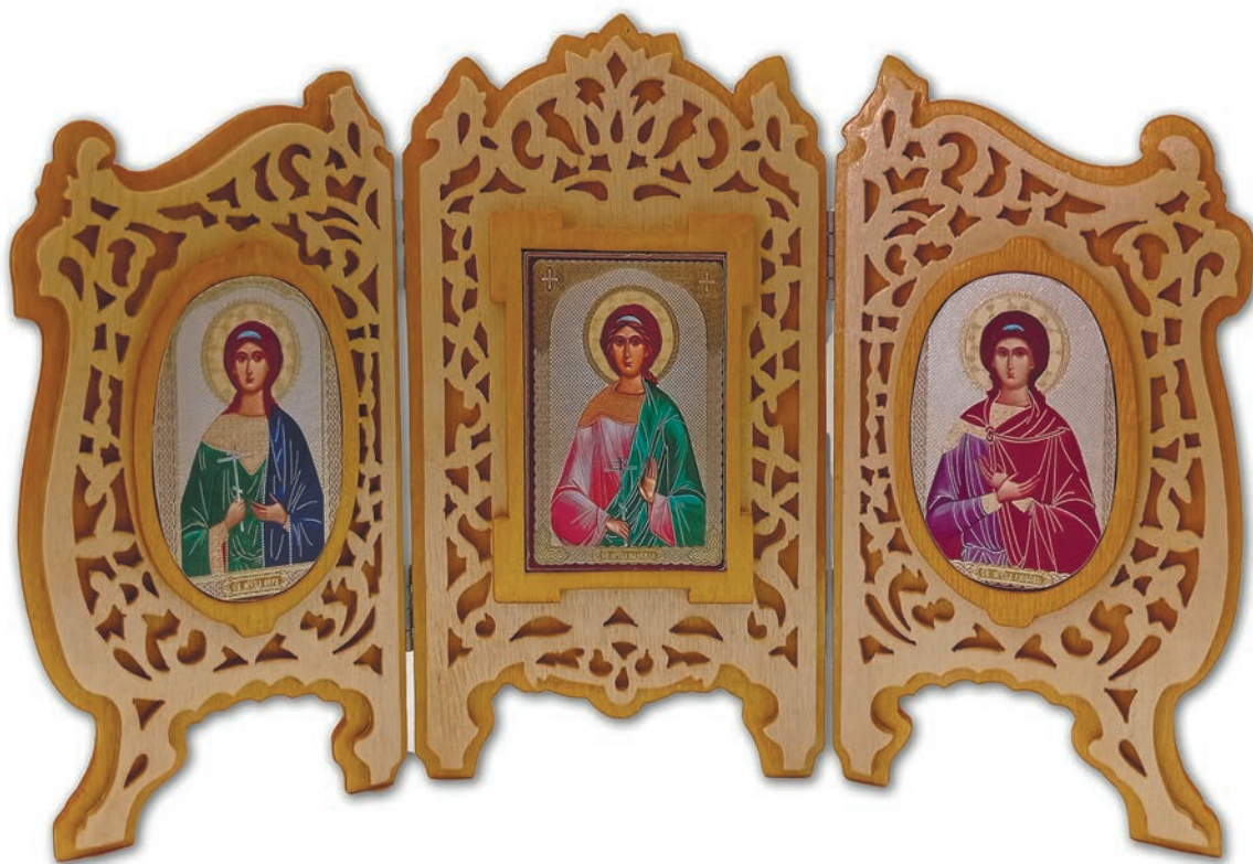
Триптих Икона, 2021 г., фанера, лак, h 20,5