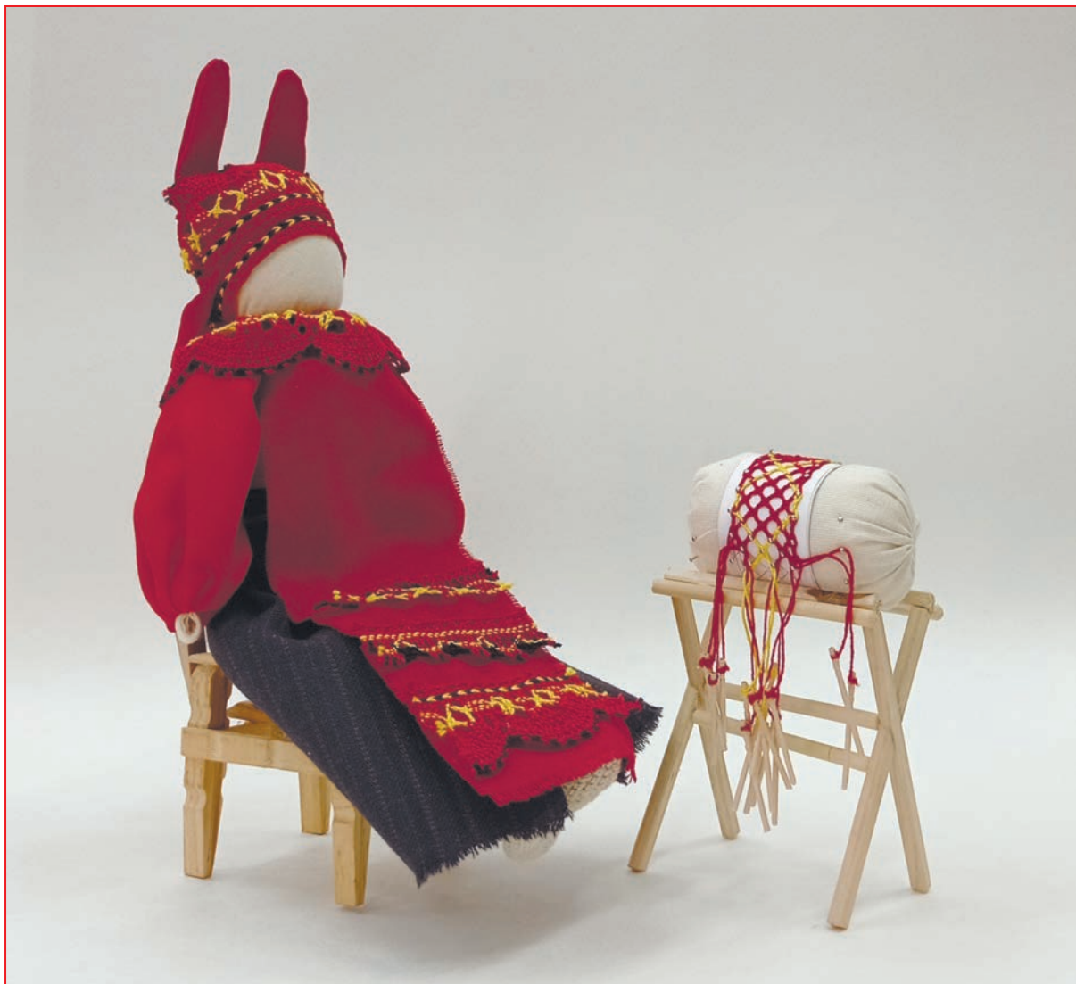
Кукла «Кружевница», 2021 г., текстильная кукла; ткань, кружево, дерево, нити, булавки, h 25