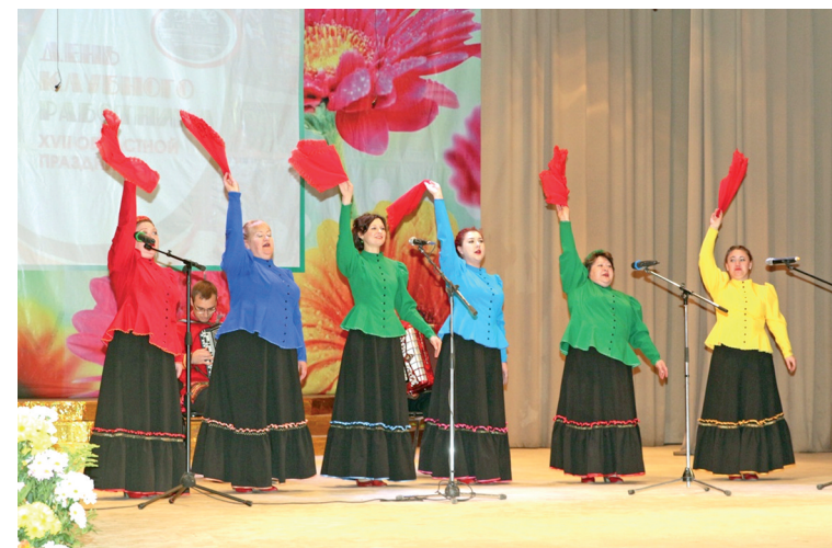
Народный любительский художественный коллектив Рязанской области песенный ансамбль «Здравица»

Вот такой он – народный любительский художественный коллектив Рязанской области песенный ансамбль «Здравица» Баграмовского Центра народной культуры деревни Баграмово, Рыбновского района Рязанской области. Сплоченный годами, собравший и взрастивший много талантливых, творческих, умных людей, любящих русскую культуру и русскую песню, посвятивших свою жизнь ее процветанию.